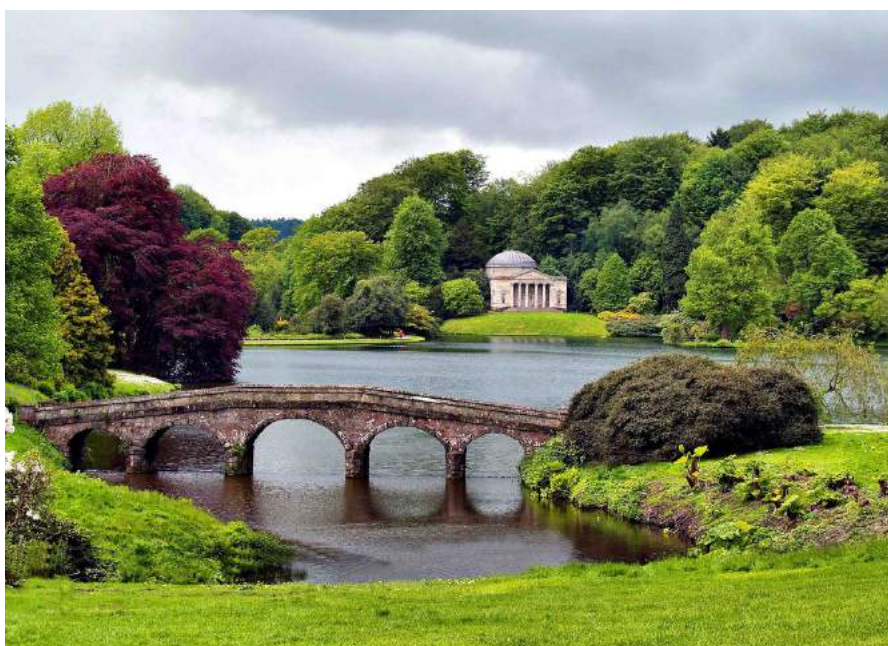
Vista del jardín de Stourhead

del viernes 15 al viernes 22 de junio de 2018 8 días (7 noches)